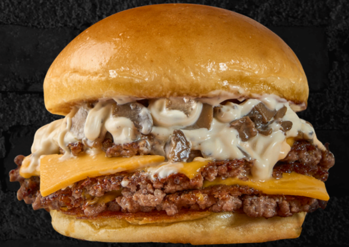
برجر فطر الترافل