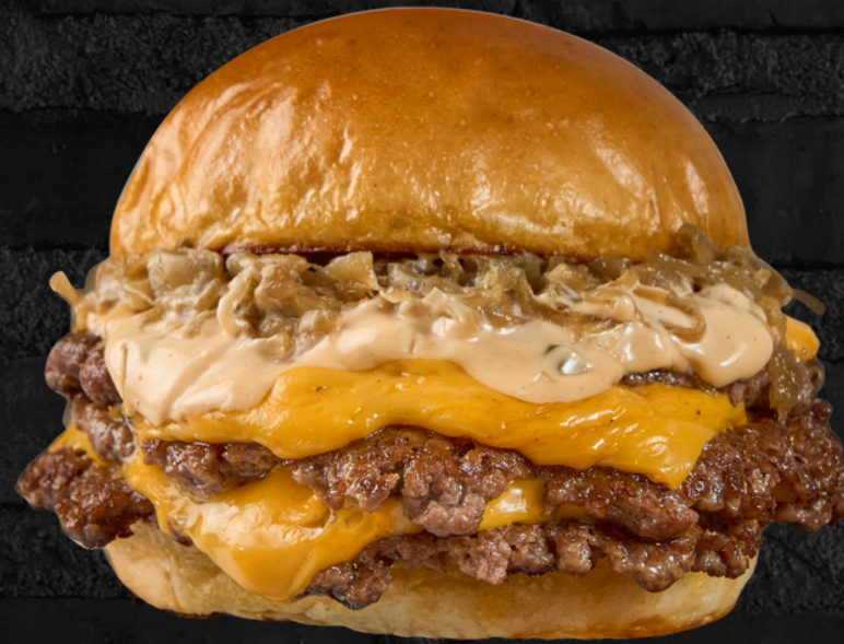
برجر البصل المكرمل