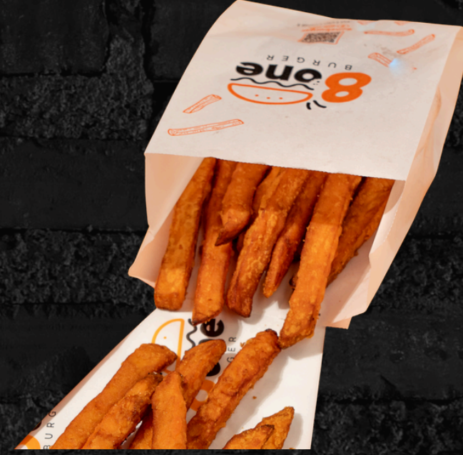
بطاطس حلوة مقلية