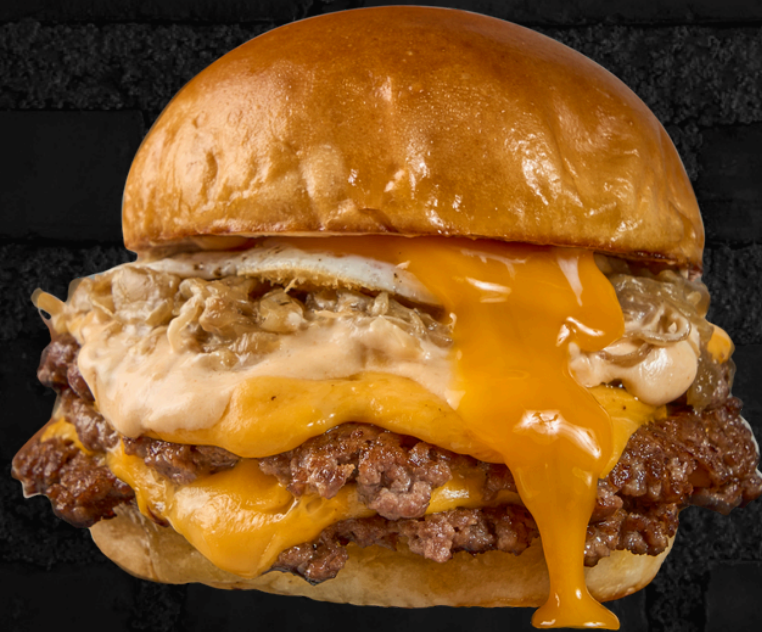
برجر إيغ باستر