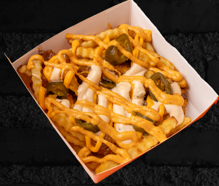
بطاطس مقلية (Animal Style)