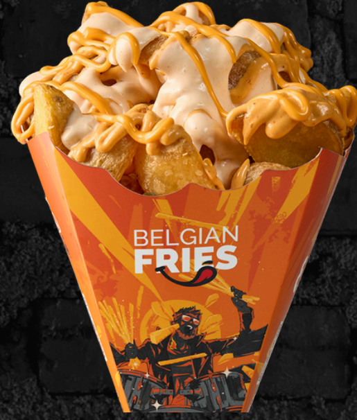
بطاطس (Belgian) مقلية